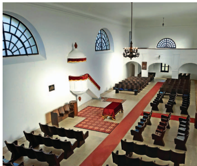
A református templom belső tere