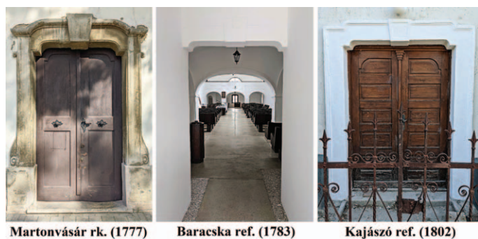
A régi református oratórium barokk stílusú főbejáratának környékbeli rokonai