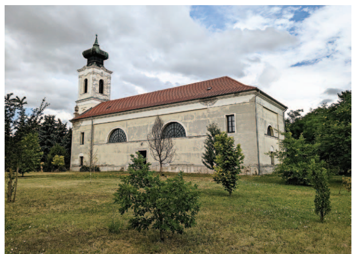
Református templom, falaiban a régi oratórium 1783.