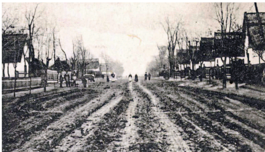
A mai Kossuth utca az 1910-es években