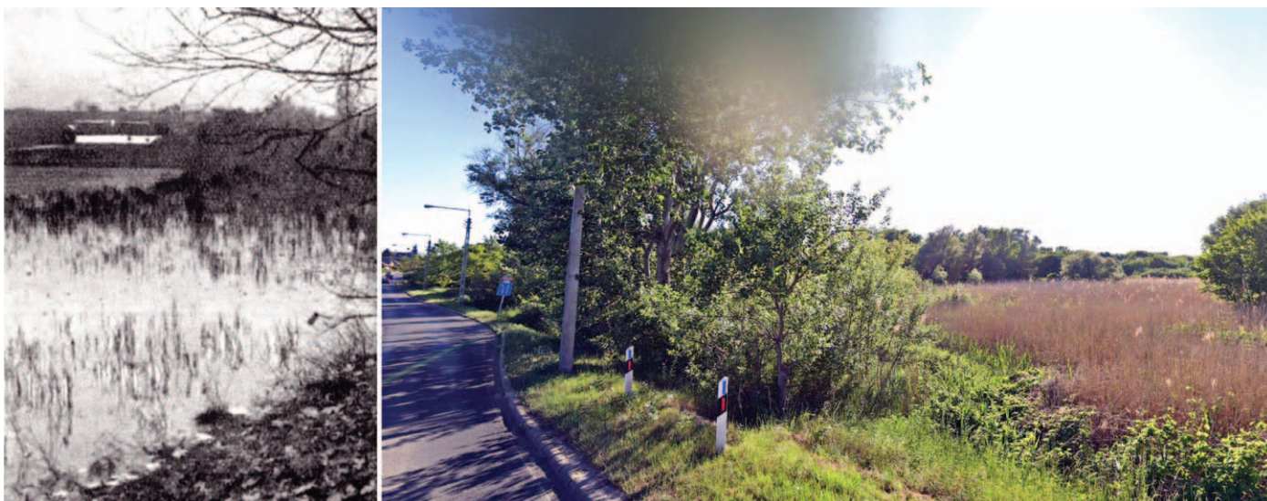
Az egykori Fekete vagy Forrás-tó helye 1932-ben és napjainkban

ház a temető mögött. Amolt-a. Szelíd lélök nem jár arrafelé, ha nem muszájn.