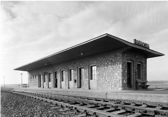
Az őrház helyett épült baracscai vasúti megállóhely 1955-ben

Déli Vasút. F. évi november hónap 1-én a budapest-sáktornyahatárszéli vonalon, a Martonvásár állomás és Pettend megállóhely között fekvő 173. sz. őrháznál Baracska elnevezéssel személyforgalmi megállóhely fog megnyitni, mely megállóhelynél a budapest-pragerhofi vonal jelenleg érvényben álló menetrendjének tartamára a 209, 210, 215 és 218 sz. személyvonatok utasai fel-, illetve kiszállása céljából feltételesen meg fog állni. Ezen megállóhelyen menetjegyek egyelőre nem fognak kiadni, hanem az illetéket (pótlék felszámítása nélkül) a vonatokban a kalauzok szedik be és számolják el. Utipodgyász ezen megállóhelyről csak utánfizetés mellett továbbítják. A vonatoknak Baracska megállóhelyen való megállására vonatkozó menetrendi adatok az ezen megállóhely megnyitására vonatkozólag kiadott és az állomásokon kifüggesztett hirdetőmenyekből vehetők ki.