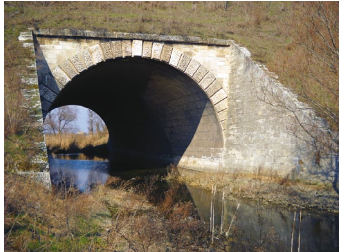
A Váli-víz alagútja a baracscai vasúti töltésben

Az országút jó magas töltése fölött 2-3 lábnyira foly sokszor a víz — az átmenő kocsikba nem ritkán becsap a hullám, s ez így tart 1-2-3 napig magán az országúton. De ha az országútról lepad is a víz, a tenger azért nem szalad el a rétségről. S ha ez így van akkor, mikor nyitva áll az egész völgy és szabadon foly a víz az egész területen, azt kérdem az én laicus eszemmel, ki a vízi munkálatokhoz nem értek: képzelhető-e, hogy az a 4 és 6 öles nyílás ott a völgy, a töltés közepén elegendő lesz oly rövid idő alatti átbocsátására a tavaszi vizeknek, hogy ideje ne lehessen az áradatnak a közel Szent-Péterig, sőt Vaálig fölszorulni s ott a helységben pusztításokat tenni? Nem is említvén a netán útban eső őszi vetésekben okozhatandó károkat. Ugy hiszem eléggé fontos az ügy arra, hogy az illetők komolyan meggondolják, ha vajjon az eszközésbe vett rendszabályok elégségesek-e a védtelen szomszédoknak károktól megóvására.