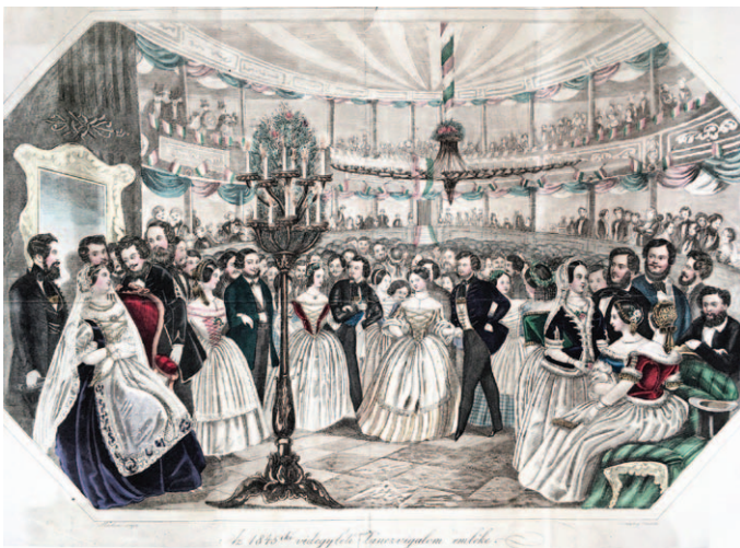
Farsangi táncvigalom Pesten 1845-ben