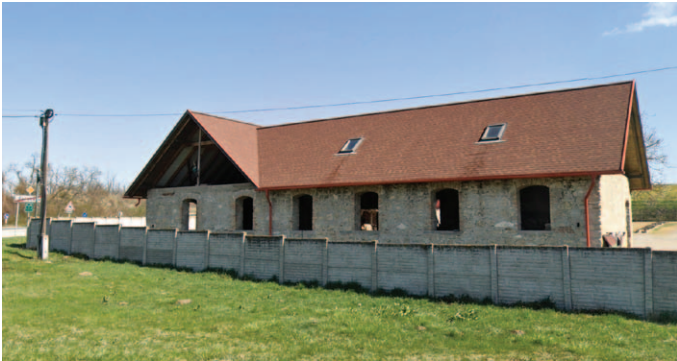
A baracscai Nagy Vendégfogadó épülete napjainkban, mellette állt egykor a reformkori táncterem

kívánsága a' különöznék – szólla jó anyám – úgy is tudom, hol van a' bibe. Azt sejtí a' kis gonosz, hogy a' vigalmat adó házi ur, mint nőtelen legény, ezen alkalmat tűzé ki, mellyen nejét leginkább kiválaszthatja; – tessék önnek szives köszönet 's tiszteletünk mellett megvinni, hogy legnagyobb szerencsének tartjuk a' vigalomban részesülhetést." Győztem e' szerint mint látod, édes angyalom, 's mintha hegyen völgyön lakodalom volt volna, tánczoltak képzetim előre is a' baracscai tánczvigalomban.